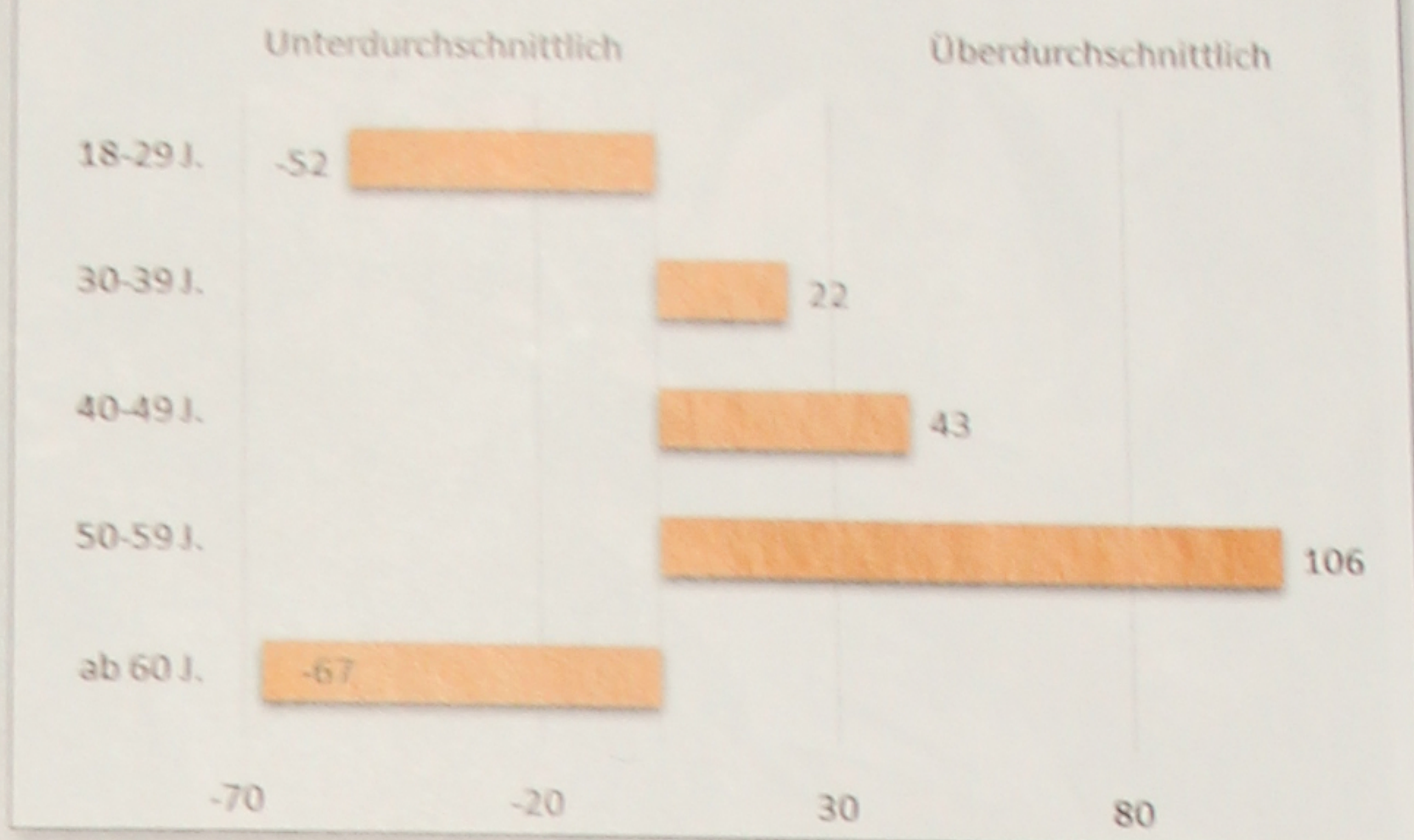
Wer fährt oft Motorrad? (Anteil an Bikern im Vergleich zum Anteil an der Gesamtbevölkerung, Durchschnitt = 0)

An den typischen Motorradtreffs ist es längst sichtbar: Der Motorradfahrer von heute ist im reiferen Alter angekommen. Das Internet-Vergleichsportaal Verivox hat diese These jetzt mit Daten untermauert, indem es zwischen Juli 2016 und Juni 2017 die über die Plattform abgeschlossenen Motorradversicherungen auswertete. Und in der Tat ist der „typische“ Biker heute am ehesten zwischen 50 und 59 Jahren alt. Auch wenn die junge Generation (18-29 Jahre), was die Altersverteilung der Biker anbelangt, eher unterdurchschnittlich vertreten ist, fährt sie dafür laut Verivox die am stärksten motorisierten Maschinen. Der Durchschnittswert liege hier bei 113 PS – dicht gefolgt von den Bikern zwischen 50 und 59 Jahren, die Maschinen mit im Schnitt 112 Pferdestärken bewegten. Generell bleiben Frauen auf dem Motorrad die Ausnahme: Unter den Verivox-Kunden machen sie nur 10 Prozent aus.