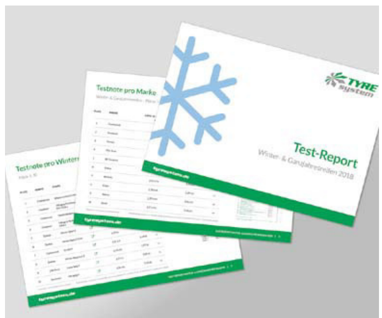
Test-Report Winter 2018: Schneller Überblick spart Zeit bei der Beratung.

Die kostenlose Verkaufsempfehlung wird halbjährlich zur Winter- und Sommersaison erstellt. Der Test-Report Winter 2018 steht unter https://www.tyresystem.de/neuigkeiten/2018/test-report-winter-2018 zum Herunterladen zur Verfügung.