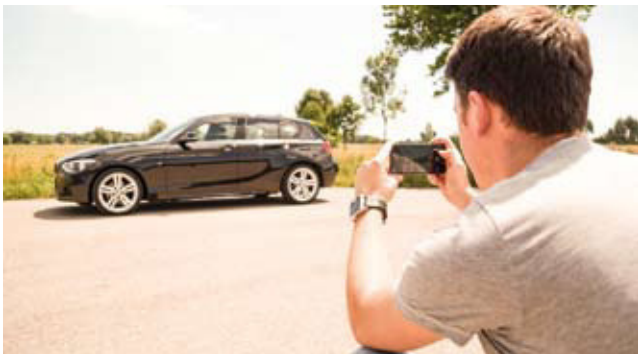
TyreSystem-Felgenkonfigurator FELGOMAT: Kundenauto fotografieren, Bild hochladen und dann virtuell am Kundenfahrzeug Felgen „anprobieren“.

So gibt es mit dem FELGOMAT neuerdings einen eigens entwickelten Felgensimulator, der Verkäufern neue Möglichkeiten bei der Kundenberatung am Point-of-Sale bietet. Mit dem Felgenmodul montiert der Werkstattprofi jede beliebige Felge aus dem Großhandelssortiment virtuell auf ein echtes Foto des Kundenfahrzeugs. Anders als bei den gängigen Felgenkonfiguratoren werden beim FELGOMAT keine 3-D-Animationen und Fahrzeugbilder „von der Stange“ verwendet, sondern ein echtes selbstgemachtes Foto. „Der FELGOMAT vermittelt durch seine realistische Darstellung am eigenen Fahrzeug dem Kunden ein sicheres Gefühl bei seiner Kaufentscheidung“, erklärt Jan Ocker, Projektleiter bei TyreSystem.