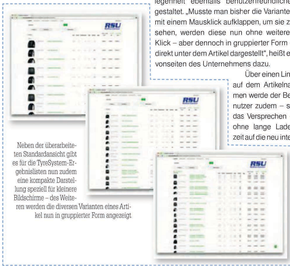
Neben der überarbeiteten Standardansicht gibt es für die TyreSystem-Ergebnislisten nun zudem eine kompakte Darstellung speziell für kleinere Bildschirme – des Weiteren werden die diversen Varianten eines Artikel nun in gruppierter Form angezeigt