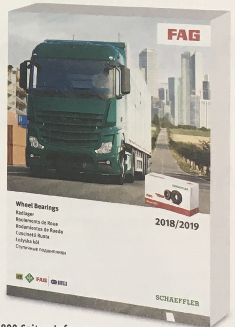
800 Seiten Infos pur: Neuer Schaeffler-Katalog

Der neue Schaeffler-Katalog „FAG-Radlager für schwere Nutzfahrzeuge 2018/2019“ bietet für nahezu jeden Einsatzbereich im NFZ-Segment die passende Reparaturlösung in Erstausrüsterqualität. Mehr als 200 Artikel der Marke FAG hat Schaeffler für die wichtigsten LKW-, Bus- und Achsenhersteller im Programm. Werkstätten haben die Wahl zwischen losen Standardkegelrollenlagern bis hin zu vormontierten, vorgefetteten Radlagereinheiten wie die FAG RIU (Repair Insert Unit) und das FAG Smartset. Neue Ap-