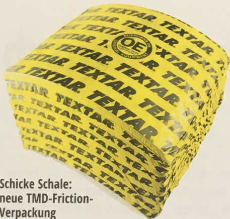
Schicke Schale: neue TMD-Friction-Verpackung

Michelin-Gruppe, das Mandat des Vorsitzenden des Renault-Verwaltungsrates übernommen. Er bleibt Vorstandsvorsitzender der Michelin-Gruppe bis zu seinem bereits geplanten Ausscheiden Ende Mai 2019.